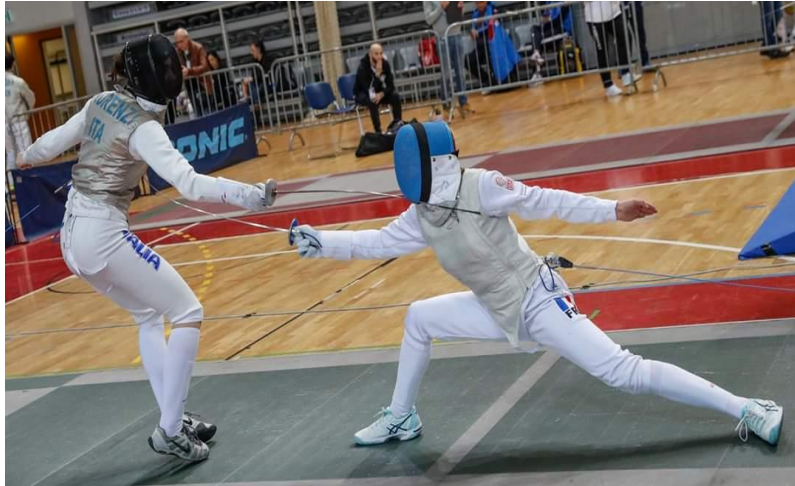
Au fleuret ,attaque en ligne basse

On donne le nom de lignes aux portions de l'espace, considérées par rapport à la main et à la lame du tireur. On distingue quatre lignes. Deux hautes (dehors dessus, dedans dessus) et deux basses (dehors dessous, dedans dessous), elles sont ouvertes ou fermées lorsque l'escrimeur place son arme dans l'une des huit positions.