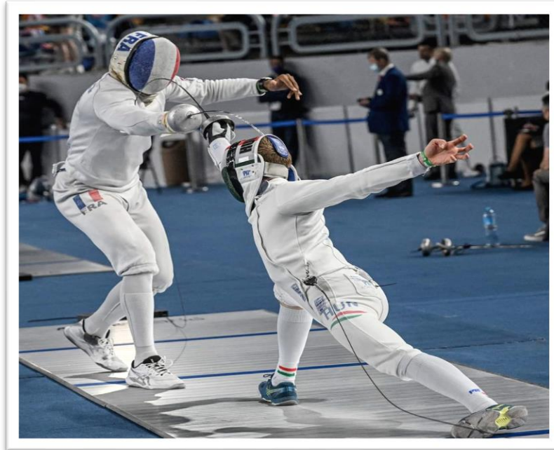
A l'épée : attaque au bras et contre-attaque au masque

Contre-offensive exécutée sur une contre-attaque adverse