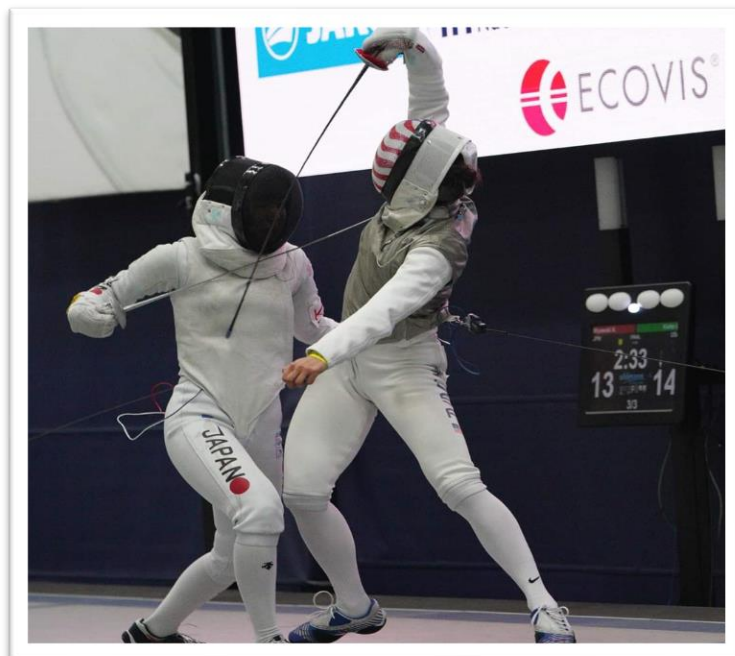
Touche portée en main de prime en combat rapproché

Actions de touche portées en même temps par les deux adversaires