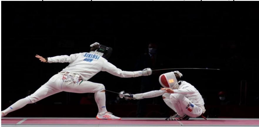
« Petit bonhomme » réalisé par l'épéiste se trouvant à droite

On trouve parmi elles : petit bonhomme, retraite, in quartata, passata di soto, ½ volte