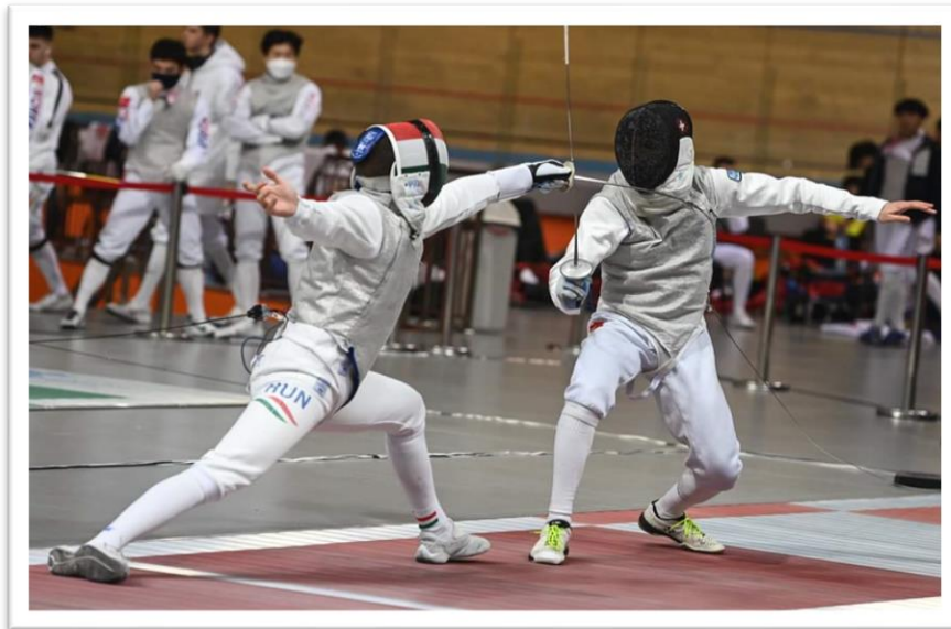
Fleuret : parade de quarte

Parer en cédant consiste à détourner la lame adverse en l'entraînant dans la ligne diagonalement opposée à celle où devait se terminer l'offensive. Ces parades sont utilisées uniquement contre les offensives réalisées par prises de fer