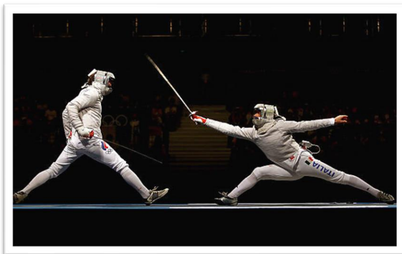
Au sabre, le défenseur effectue une grande retraite pour éviter une attaque à la tête

Au sabre les actions offensives et contre-offensive portent le nom des cibles visées. Exemple : attaque à la tête, riposte au flanc, contre-attaque à la manchette.