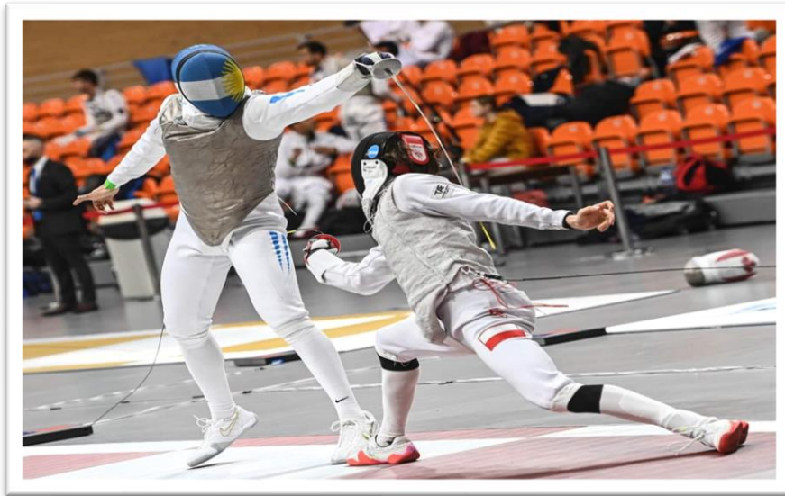
Au fleuret, riposte sur le dos

Action composée effectuée après avoir parée l'offensive adverse, réalisée en utilisant au moins une feinte, et de pied ferme, en se fendant, en marchant et en se fendant ou en flèche