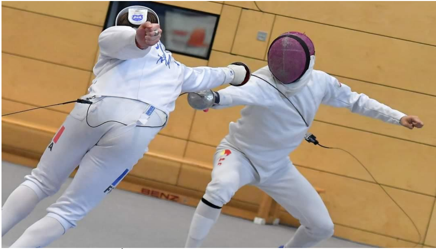
À l'épée, Attaque en flèche

Geste offensif consistant en un léger déséquilibre du corps vers l'avant, précédé d'un allongement du bras et conjugué avec une détente alternative des jambes (sorte de passe avant)