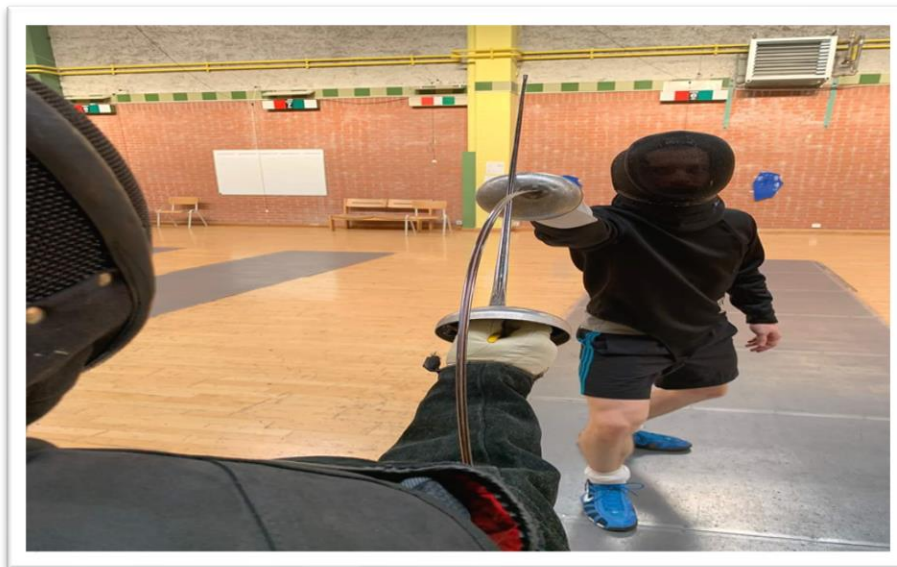
Opposition de sixte réalisée à la leçon d'épée

Prise de fer diagonale où l'on s'empare de la lame adverse en la maîtrisant progressivement d'une ligne haute à une ligne basse opposée ou vice-versa